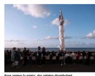
Pour célébrer la soirée, des artistes débambulent sur la digue.

« Le meilleur invité de la soirée, c'est sans aucun doute le soleil », plaisante Sé, toujours avec une belle et bonne humeur. Si la pluie a pu les troubler pour de nombreuses années, elle n'est pas venue déranger le bon moment de la soirée. Les 6 000 convives ont pu profiter de la soirée en toute sérénité, malgré les quelques nuages qui se sont levés au cours de la soirée.