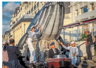
Deux débambulations de rue, quatre fanfares et cinq feux d'artifice ont animé la plus grande soirée de Cabourg.

tôt, en deux heures. Pour mettre en place les tables et les chaises, les équipes de la Ville étaient réunies dès 3 h du matin, malgré la pluie, malgré le vent, finissant de dresser les nappes, encore à 19 h. Les convives se sont installés avec plus ou moins d'expérience, quelques-uns sortant les sandwichs quand d'autres s'offraient un plateau de fruits de mer sur trois étages. Le soleil s'est invité au Dîner des