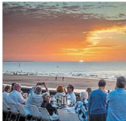
Le dîner sur la digue, le grand événement qui clôt la saison estivale à Cabourg, réunit 6 000 personnes devant le coucher de soleil.

après les cinq feux d'artifice qui viendront embraser la promenade, à 21 h 30.