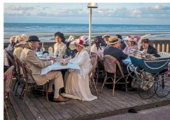
Les costumes sont devenus une tradition comme ceux de la Belle Époque.

Cabourg — C'est une tradition locale qui vient marquer la fin de la saison estivale, le Dîner sur la digue a bénéficié, samedi, d'un ciel magnifique, après un après-midi pluvieux.