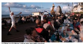
Le Dîner sur la digue a réuni plus de 6 000 convives.

Une ambiance et une vue Sur la digue, sur plus de 3,5 kilomètres, la promenade Marcel-Proust a accueilli plus de 1 000 tables avec un motif d'ambiance unique.